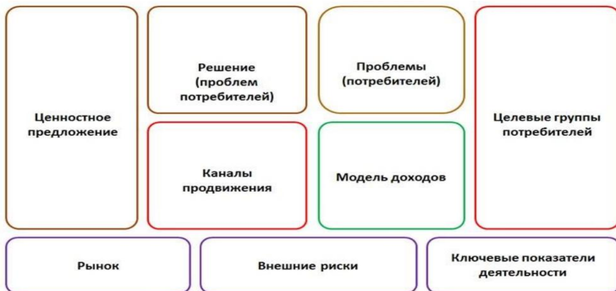
Рис. 3. Схема-алгоритм создания бизнес-модели в инновационной экономике.

Структурными элементами контрольной работы являются: