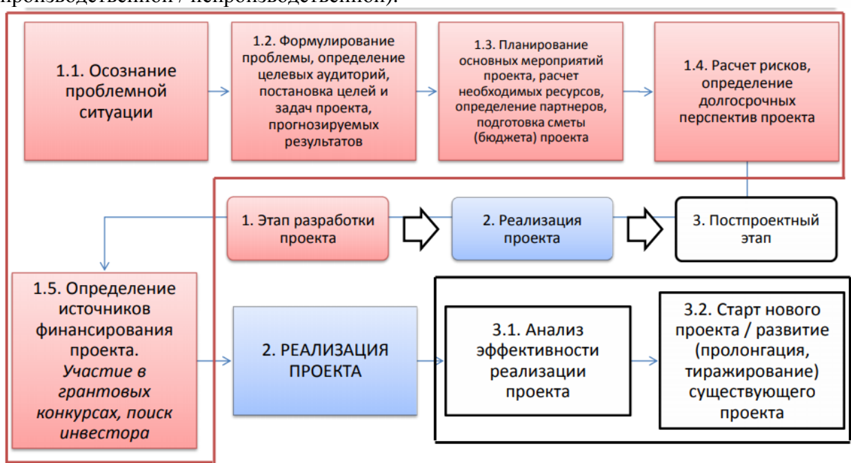
Рис. 2. Схема-алгоритм создания бизнес-модели в инновационной экономике.

Задание. Изучите материал представленных на сайте [ https://www.openbusiness.ru ] описаний готовых руководств для разработки бизнес-планов и составьте алгоритм создания бизнес-модели в инновационной экономике производственной / непроизводственной сферы по схеме на рис. 2 и бизнес-модель бизнес-модели в инновационной экономике по схеме на рис. 3 (на выбор для одной из сфер – производственной / непроизводственной):